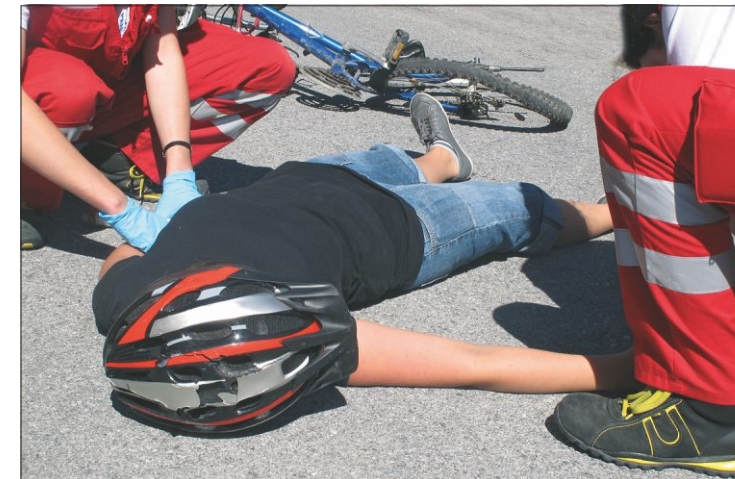
Muss es zuerst Tote geben? Und wer übernimmt dann die Verantwortung? Die Nein-Sager?

Das Gegenteil ist richtig: Nur dank der Massnahmen für Ligornetto wurden Nachbargemeinden und Kanton jetzt aktiv. Stabio führt – ausdrücklich mit Hinweis auf die geplanten Massnahmen von Ligornetto – Tempo 30 auf der Strasse vom Grenzübergang San Pietro ein. Auch bei den unbefriedigenden semafori e rotonde tut sich einiges. Der nächste, zwingende