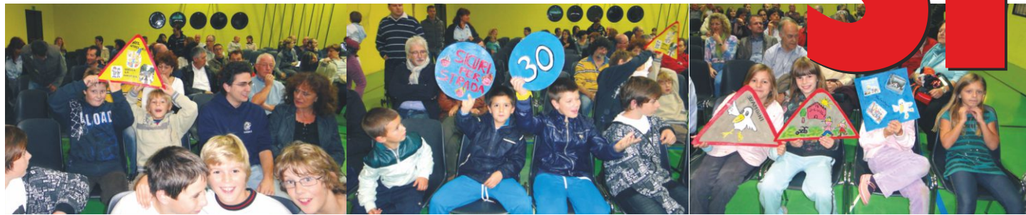
Die Tempo-30-Zone soll den Verkehr auch ausserhalb der «Sperrstunden» einschränken. In Zukunft wird es nicht mehr möglich sein, durchs Dorf zu rasen – vorausgesetzt, die Bevölkerung stimmt JA für eine Tempo-30-Zone.